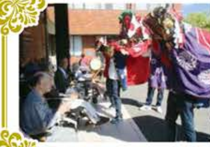
獅子に邪気を食べてもらいました!

10月12日(土)、秋晴れの空の下「風袋町青年会」と「風袋町子供会」の皆さんと「福新弁天会」の皆さんが施設に来所して下さい、獅子舞を披露して下さいました。「暑い中ありがたいね。」「毎年楽しみなんや!」と皆さん嬉しそうです。順番に獅子に頭を觸んで邪気を食べてもらい、「これで運氣が上がるかな?」と皆さん嬉しそうでした。【担当】神原