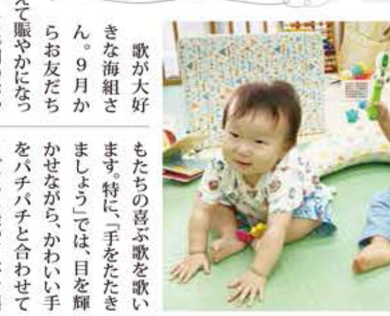
歌が大好きな海組さん。9月からお友だちも増えて賑やかになってきました。朝のおやつを食べ終えると、朝の会のはじまりはじまり♪保育者がピアノを弾き始めると、みんな一斉にピアノの方に注目します。季節の歌や手遊びなど、子どもたちの喜ぶ歌を歌います。特に、「手をたたきましよう」では、目を輝かせながら、かわいい手をパチパチと合わせてリズムに乗って体を揺らせる姿がとても可愛いです!これから寒くなってきましたが、元気がいっぱい歌をうたいながら楽しい園生活を過ごしていきたいと思っています。【担当】浜崎