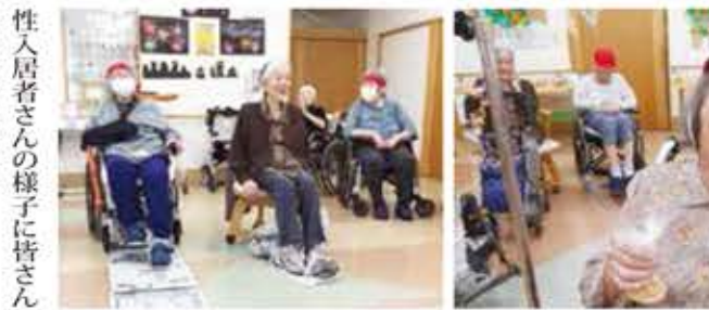
性入居者さんの様子に皆さんで大笑いしました。また、来年も楽しい運動会にしましょう。【担当】藤田

10月27日(日)、秋の運動会を開催しました。初めに、赤白帽をかぶりケガをしないようにと準備体操、ラジオ体操をしました。今年の最初の競技は物送りゲームといって全員輪になり隣の方に大きき異なる物を「どうぞ。」「はい。」「と声をかけながら行うもので、大きなボールになると戸惑う方も見られ盛り上がりしました。次に行ったハン食い競争では、もつと盛り上がりを見せられました。つるしたパンを、なるべく口で取ろうと皆さん必死に頑張っていました。中には手を使い口まですてていきかぶりつく男