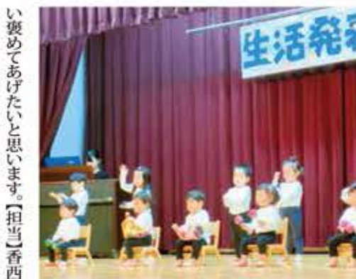
緊張しながらも頑張った子どもたちを、いっばい褒めてあげたいと思います。【担当】香西

「い・ち・ご、うん」お辞儀のやり方、楽器を鳴らすタイミングなど、毎日のように練習してきうに練習してきたことを、本番でもしっかりと披露した子どもたち。大勢の人たちの前でも、しっかりと曲紹介をしたり、堂々と演奏したりする姿に成長を感じた発表会でした。