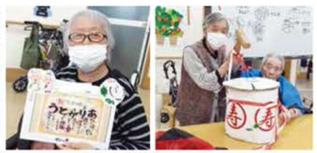
感謝を込めたカードをお渡ししてお開きとなりました。【担当】中原

9月16日(月)、今年の敬老会は手作りの白あん饅頭と寿と字の入った酒樽割りでお祝いしました。皆さんには赤や青の法被を着てもらい、柀で叩いてもらいました。パッカーンとふたが割れると「うわーすごい。」「初めてしました。」「皆さん生き生きとした表情になりました。割れた酒樽の中のリジュースを楽しく選んでもらえました。白あん饅頭は見本の様には形がなかなかできず苦戦しましたが、お茶と頂くと、とても美味しかったと言われていました。最後に日頃の