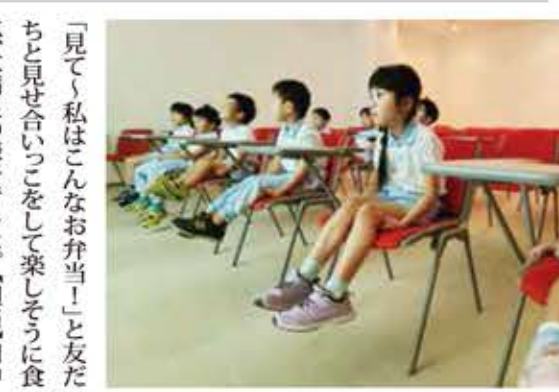
「見て〜私こんなお弁当!」と友だちと見せ合いつつ楽しそうに食べて大満足の様子でした。【担当】田中

10月に防災センターへ見学に行きました。災害が起きた時、どのように避難するのかを実際に体験しながら学びました。迷路のような場所に入り、口を押さえ、腰を低くして避難する練習や、大きな地震がどのように揺れるのか震度5強の揺れを体験するなどいろいろな事を知ることが出来ました。見学後、歩いて生島公園まで行き、遊具で遊んだりみんなで鬼ごっこをしたりしました。沢山動いた後は、楽しみにしていた手作り弁当を食べました。