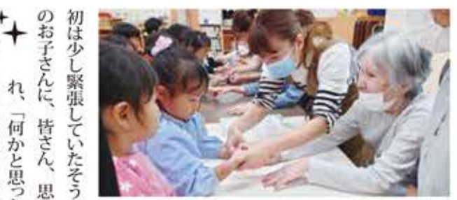
綺麗なフラガールの皆様にレイをかけてもらい、皆さん楽しんで一緒に踊っていました。【担当】小西

9月13日(金)、らく楽新田祭りを開催いたしました。今年は2部構成! まず、午前中はエレクトーン演奏、1曲目は暴れん坊將軍のテーマからの激しいスタートです。3曲目は皆さんなじみ深い唱歌ふるさとを全員で合唱しました。「あのううまいなあ。」とパワーに圧倒されつつも、皆さんのお好きな曲も多く、喜ばれていました。ご家族様方と一緒に食事休憩をはさみ、午後からはひまわりフラスタジオの皆様です。